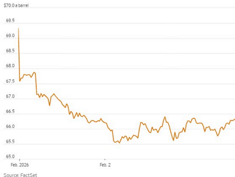
Most-active Brent crude-oil futures contract