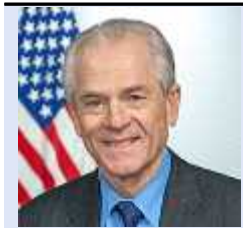
피터 나바로 (Peter Navarro)