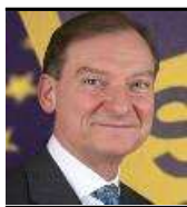
폴 앳킨스 (Paul Atkins)

- 또한, 앳킨스는 바이든 행정부의 금융 관련 시행규칙을 재검토할 것으로 전망