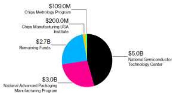
〈반도체법 R&D 지원금 구성〉

* 390억 생산 인센티브와 별개로 110억 달러 R&D 지원금 지원