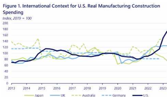
<미국 및 주요국 제조시설 예산 비교>

* '22년 기준, 주요국 대비 미국의 신규 제조시설 예산 급증세