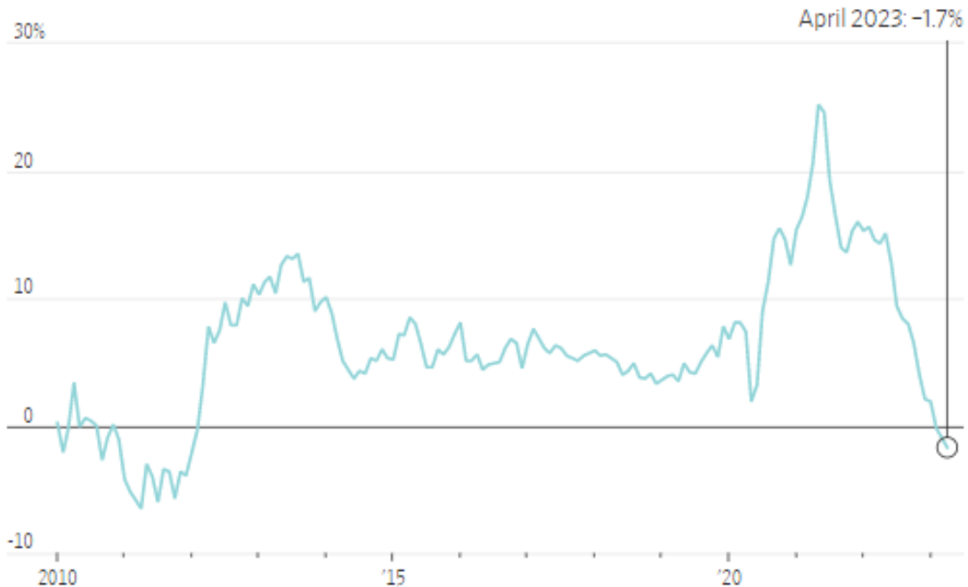
U.S. median existing-home price, change from a year earlier

Note: April 2023 data is preliminary.