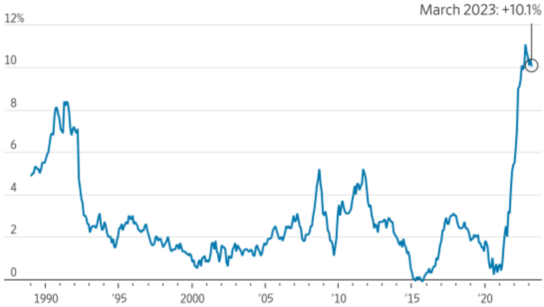
U.K. consumer-price index, 12-month change