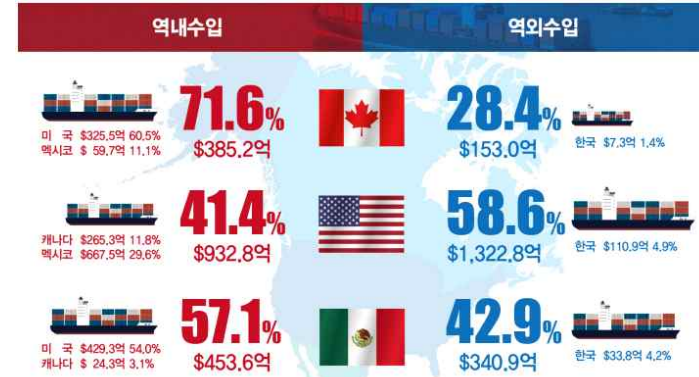
<북미 자동차 주요 소재·부품 역내·역외 수입 현황>